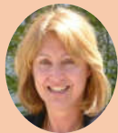
Chantal PETITOT Directrice départementale de la cohésion sociale et de la protection des populations